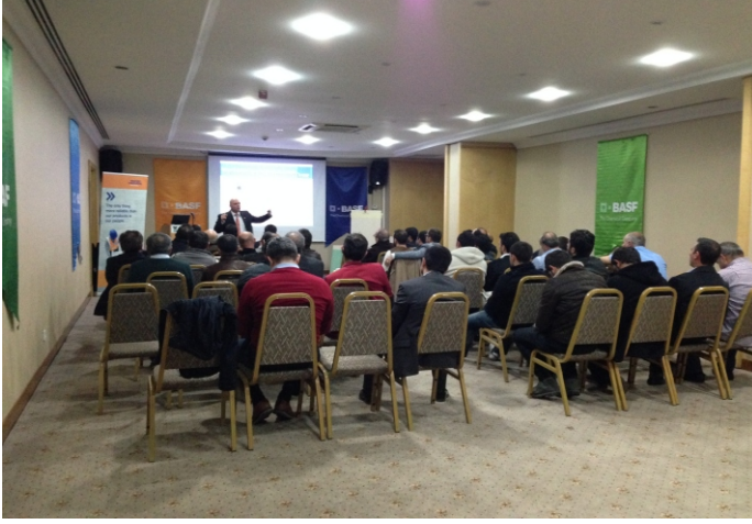
The Green Park Hotel - Merter

Anadolu Yakası, İzmit, Avrupa Yakası, Çorlu ve Tekirdağ'da gerçekleştirdiğimiz mini lansman etkinliğimize toplam ikiyüz kırk kişi katıldı.