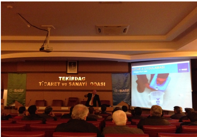
Tekirdağ Ticaret Odası - Tekirdağ