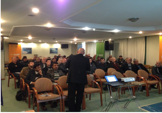
Sefa Hotel - Çorlu